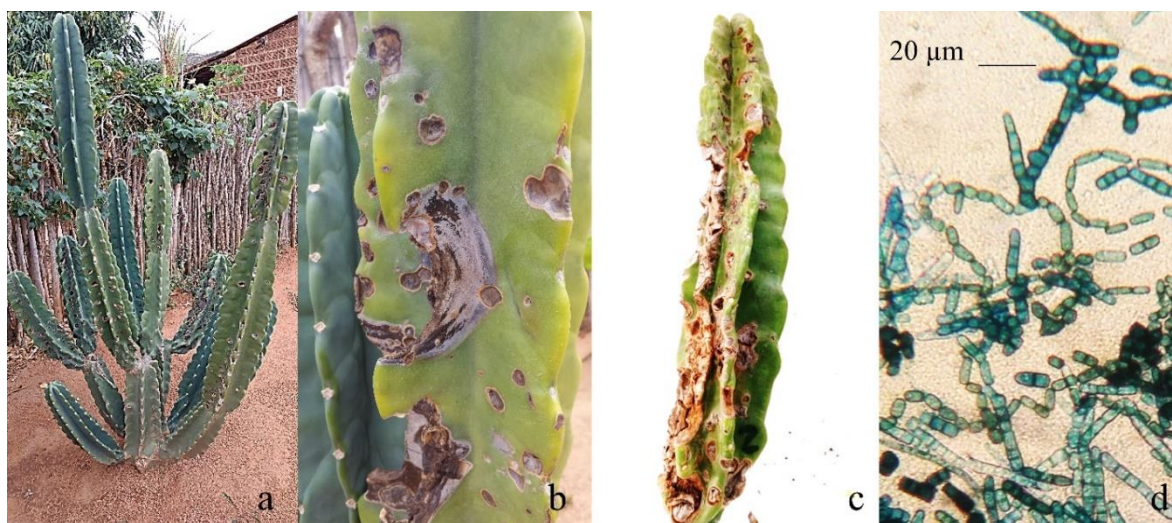
Figura 2. Síntomas de pudrición escamosa en plantas de mandacaru sin espinas ( Cereus hildmannianus ) (a) y galerías (b y c) causados por Scytalidium lignicola ; y estructuras de conidios de S. lignicola (d).